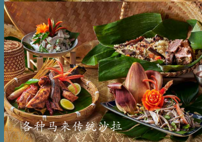
各种马来传统沙拉