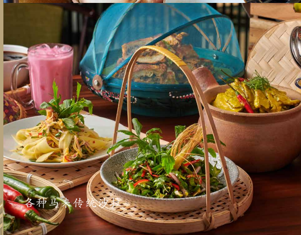
各种马来传统沙撈越